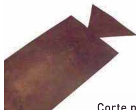
Corte para armado.

Un sello de humedad fabricado en PVC reforzado o caucho Nitrilico, en formato de rollo con un ancho específico para cada dilatación.