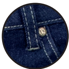
REMACHES EN BOLSILLOS