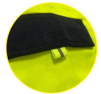
PULLER REFLECTIVO EN BOLSILLOS