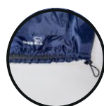
AJUSTE EN CINTURA