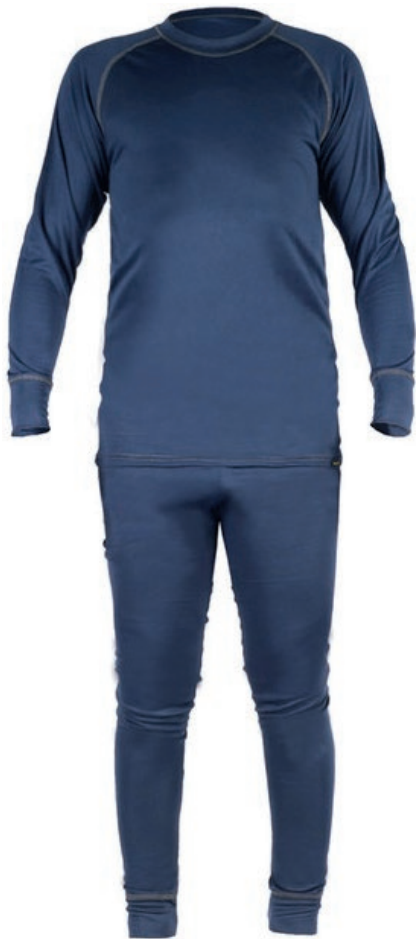
PIJAMA THERM 4000 POLIESTER