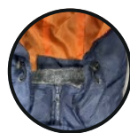
GORRO DESMONTABLE CON AJUSTE