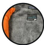
FORRO INTERIOR DE CHIPORRO