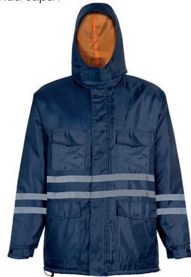
PARKA THERM 6000 SIBERIA CERTIFICADA