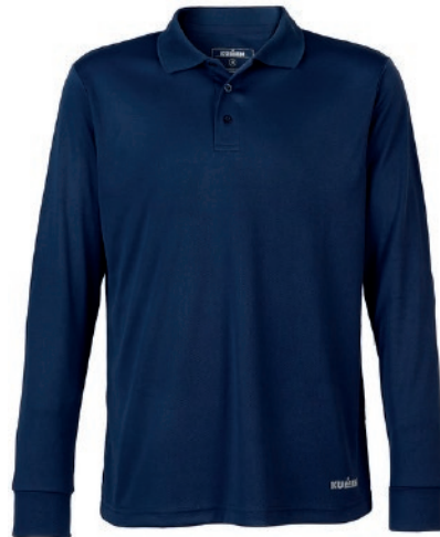
POLERA COOLDRY PIQUE AZUL KUMEN