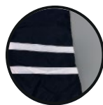
CINTAS REFLECTANTES 360°