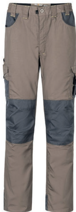
PANTALON TECNICO VULCANO BEIGE KUMEN