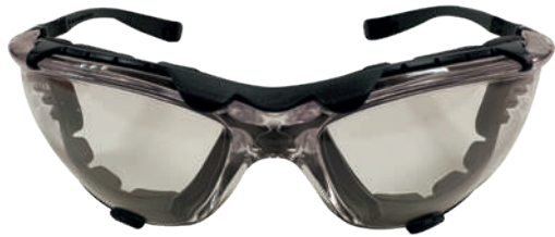
LENTE LIDO ULTRA

Complementa tu outfit con la camisa Lodge, pantalón Lodge de KUMEN y los lentes Lido ultra.