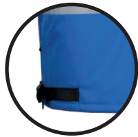
AJUSTE DE CINTURA