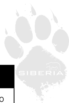
TABLA DE MEDIDAS HOMBRE