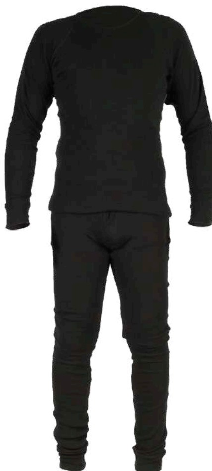
PRIMERA CAPA POLIPROPILENO