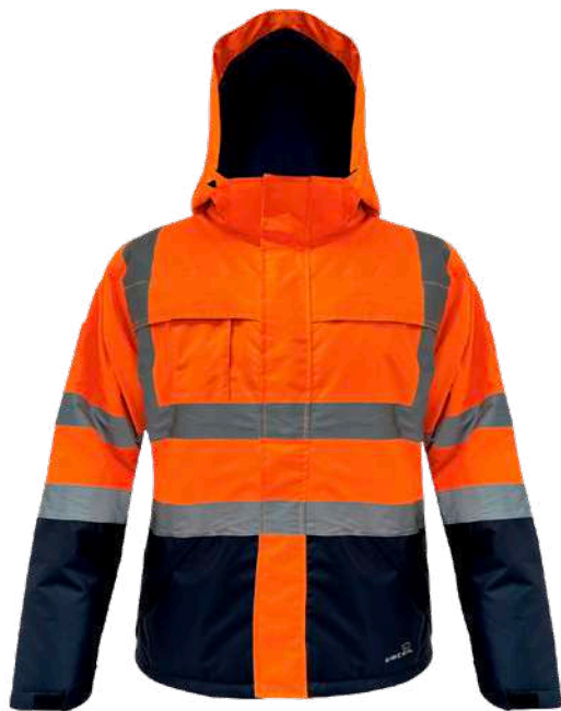
PARKA NEBRASKA S10

• Modelos ideales para complementar tu Jardinera Nebraska S10 y conseguir su máximo desempeño.