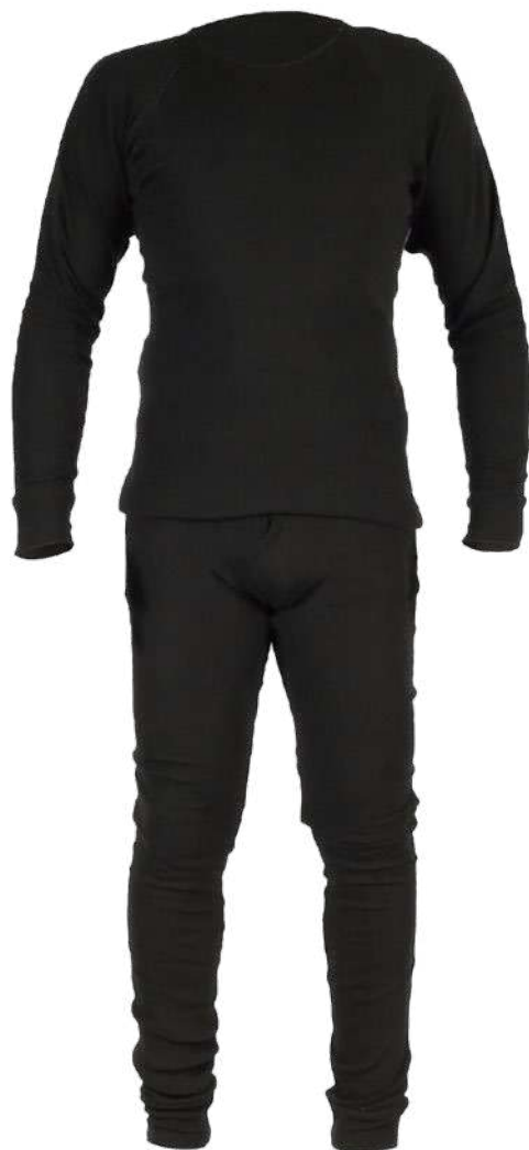
PRIMERA CAPA POLIPROPILENO