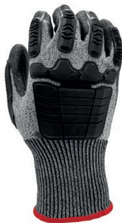
GUANTE FLEX 6300T