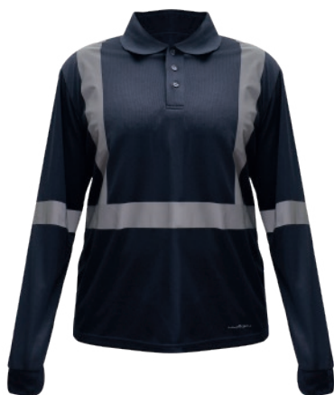
POLERA COOLDRY CON CINTA REFLECTANTE ELASTICA