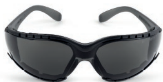
LENTE LIDO ULTRA

Complementa tu outfit con Polera cooldry con cinta reflectante elastica, Pantalón cargo alta resistencia spandex, Lentes Lido ultra y Guante flex 6300t