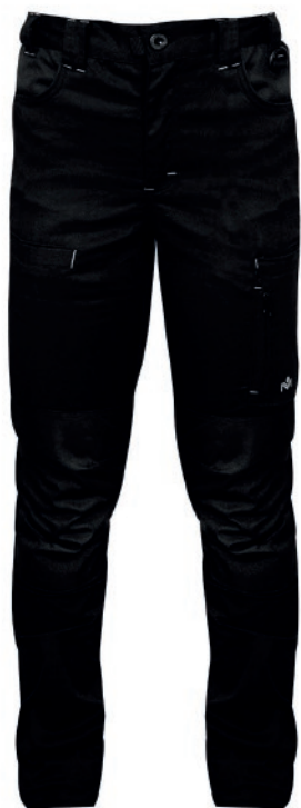
PANTALON CARGO ALTA RESISTENCIA SPANDEX