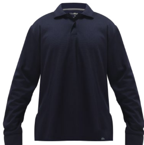
POLERA KUMEN WAFFLE

• Modelos ideales para complementar tu Pijama Polipropileno, Polera Kumen Waffle, Parka y Jardinera Nebraska y Guantes Nevatech.